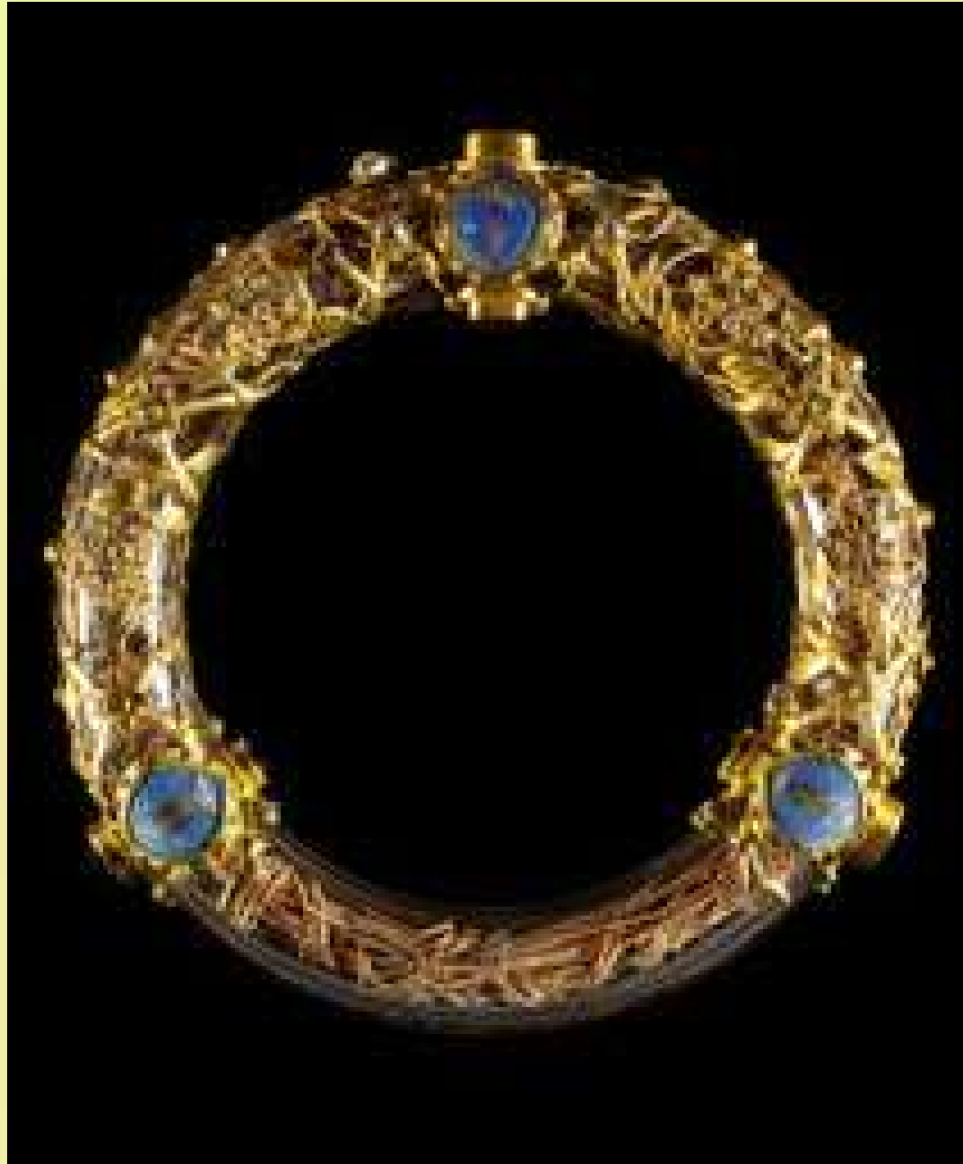
La Sainte Couronne