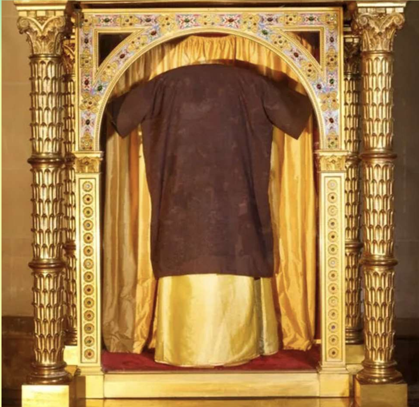
La Sainte Tunique